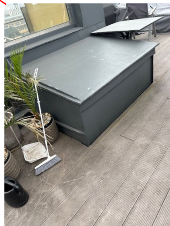
Armatyr runt låda