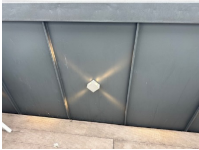
Armatyr på vägg