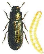
MJÖLBAGGAR Angriper främst spannmålsprodukter. 4–6 mm. Larven kan bli 10 mm.