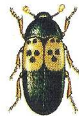
FLÄSKÄNGER Lever huvudsakligen av kött, ost och torkad fisk. Skalbaggen blir 6–12 mm.

Föreningen anlitar städentreprenör som utför städning i trapphall/entréhall och motionslokal normalt en gång i veckan (kan bli två ggr i veckan vid slaskigt väder). K1korridoren städas en gång i månaden.