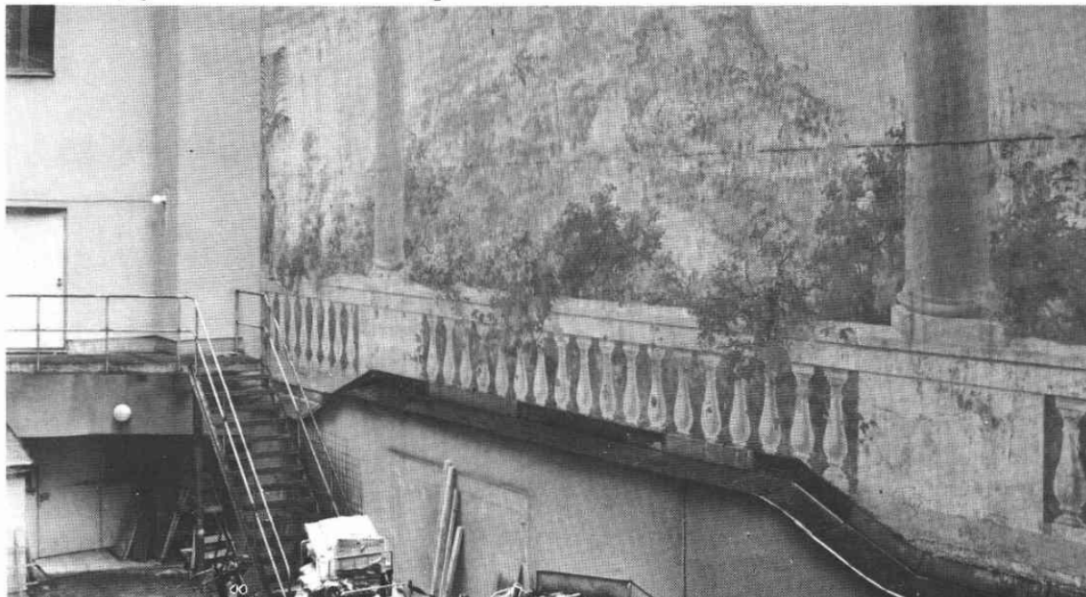
Skotten 9, gård och brandmursmålning